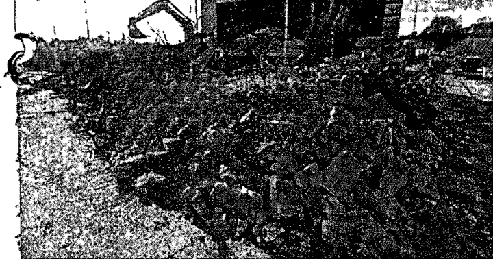
Uklanjanje ostataka gostionice 'Putnik'